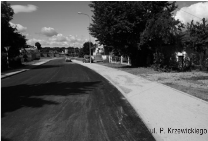
ul. P. Krzewickiego