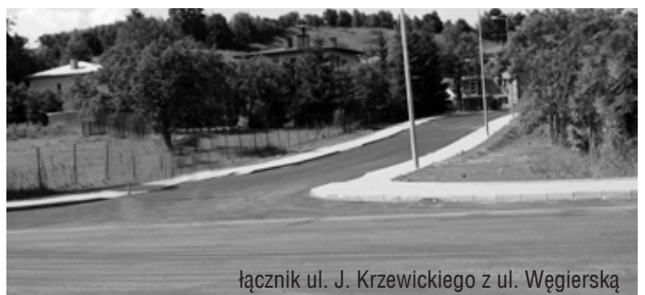
łącznik ul. J. Krzewickiego z ul. Węgierską

Koszt zadania to kwota 3 767 663 zł. Dotacja z budżetu państwa wyniosła 50 % kosztów realizacji inwestycji – 1 902 741 zł. Dzięki tym środkom wybudowano ul. Żeromskiego – 181 m, wyremontowano ul. Pod Lodownią – 180 m, wykonano łącznik ul. Pod Lodownią z ul. Węgierską – 193 m, wyremontowano ul. Armii Krajowej – nawierzchnia i chodniki ( 290m) oraz ul. Szpitalną – 110 m. Wykonawcą było konsorcjum gorlickich firm "Godrom-u", i "Hażbudu"