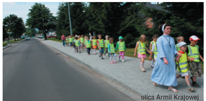
ulica Armii Krajowej

Końcem września została zakończona realizacja budowy, przebudowy i modernizacji ciągu ulic miejskich, łączących drogę krajową nr 28 z drogami wojewódzkimi nr 993 i 977 w ramach Narodowego Programu Przebudowy Dróg Lokalnych 2008 – 2011, czyli tzw Schetynówek.