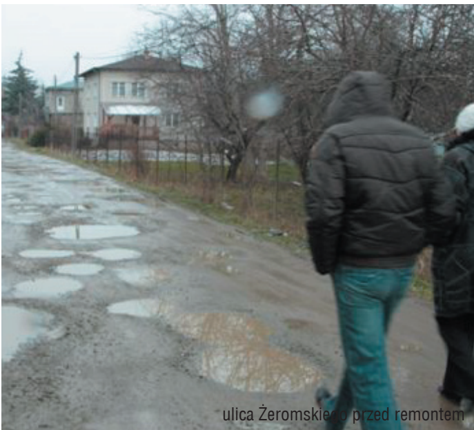
ulica Żeromskiego przed remontem

Dotacja stanowi 50% wartości planowanych do realizacji zadań. Drugą „połówkę” zabezpieczono w budżecie miasta na 2009 r. W ramach tej kwoty zaplanowano realizację budowy i modernizacji ulic: Żeromskiego, modernizacja części ul. Pod Lodownią, budowa łącznika ul. Łokietka z ul. Węgierską oraz modernizacja całej ul. Armii Krajowej- łącznie z chodnikami, przebudowa ul. Szpitalnej do skrzyżowania z ul. Sienkiewicza.