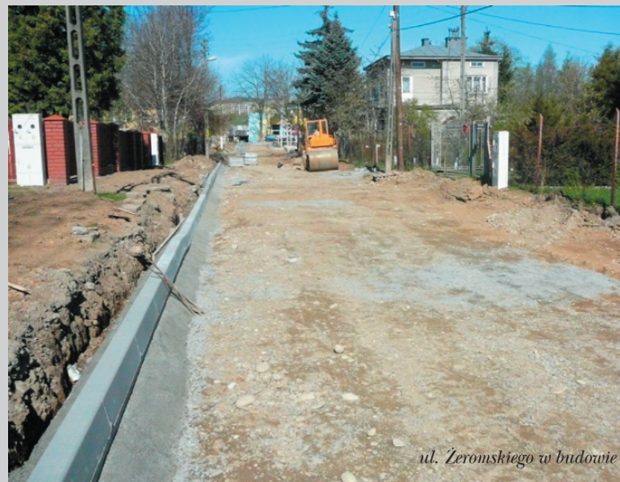
ul. Żeromskiego w budowie