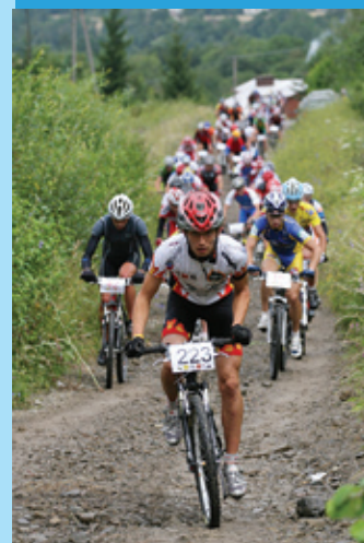
Wegetariański Maraton, str. 4