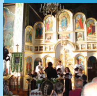
Muzyka cerkiewna, str. 4