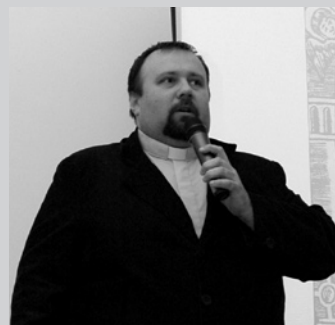
IKONA, IKONOSTAS I SYMBOLIKA IKONY MARYJNEJ

Szkoleniowo-Rehabilitacyjnego im. Św. Ojca PIO w Stróżach. Temat wykładu- prelekcji „Jak dobrze się starzeć- gerontologia w aktywizacji społecznej”, spotkał się z dużym zainteresowaniem i uznaniem. Doskonale przygotowana i zaprezentowana problematyka przybliżyła słuchaczom „złotego wieku” proces starzenia się, wskazując równocześnie, co robić, by jak najdłużej być aktywnym społecznie. Pomagają w tym uniwersytety trzeciego wieku- w Gorlicach Uniwersytet Złotego Wieku.