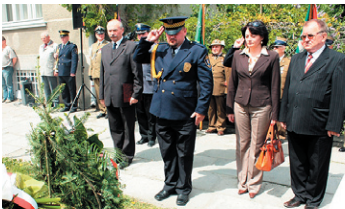
Żłożenie wieńców w miejscu pamięci narodowej - Szklarczykówka, w dniu 8 maja br.