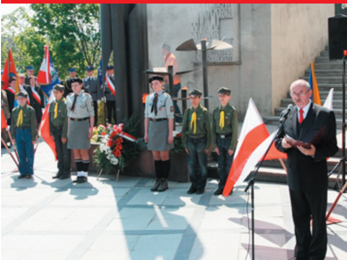
Uroczystość przy Pomniku 1000-lecia Państwa Polskiego