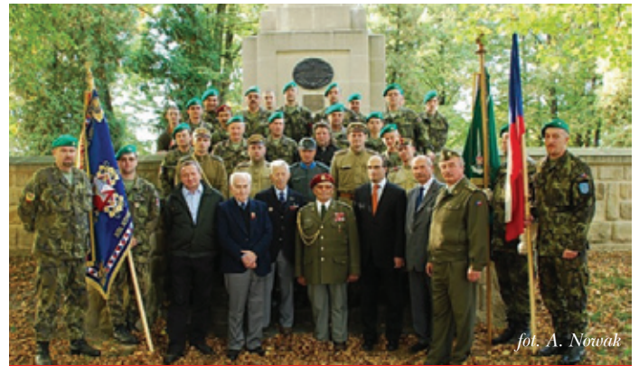
fol. A. Nowak