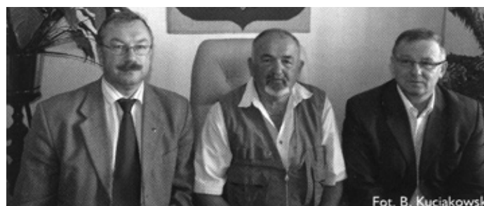
Fot. B. Kuciakowski

23 października br. w Ośrodku Szkolno – Wypoczynkowym w Zduni odbyły się uroczystości związane z 10-leciem Informatora SIMP – Kwartalnika Stowarzyszenia Inżynierów Techników Mechaników Polskich – Oddział w Gorlicach.