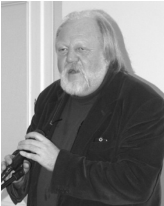
WOLNOMULARSTWO, CZYLI MASONERIA BEZ TAJEMNIC