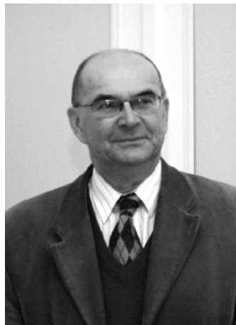
Kultura Ludowa Pogranicza- Łemkowszczyzny i Pogórza

downe fotografie pogranicza autor zdjęć, Kamil Bańkowski, rodowity sądeczanin, młody człowiek z wielką pasją utrwalania magicznych krajobrazów- wschodów i zachodów słońca, mgieł, promieni światła, gwiazdzistej nocy. Większość fotografii znalazła się w albumie „Piękno wspólnej krainy”- dziś krainy bez granic- wydanej przez Katolickie Centrum Edukacji Młodzieży „KANA” w Nowym Sączu.