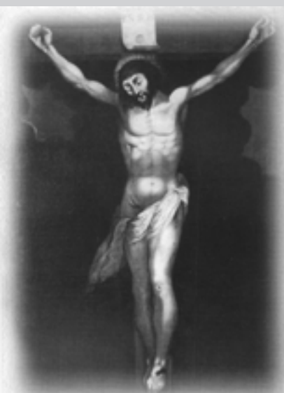
Laskami słynący obraz Pana Jezusa Ukrzyżowanego w Kobylance

mał obraz Jezusa Ukrzyżowanego- kopię watykańskiego obrazu. Ukazana na obrazie postać Jezusa jest zgodna z opisem Św. Jana – „Jezus rzekł: Wykonało się. I skłoniwszy głowę wyzionął ducha”. Umieszczony został w kaplicy dworskiej, nad która 7 grudnia 1681 r. pojawiła się niezwykła