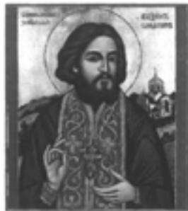
św. Maksym Gorlicki

WYZNANIA ZIEMI GORLICKIEJ PRZESZŁOŚĆ I TERAŹNIEJSZOŚĆ