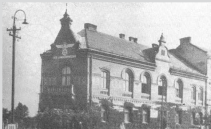
Urząd Landkomisarza w budynku Starostwa

Roman Dziubina (wykorzystano informacje i zdjęcia zawarte w książce Władysława Boczonja i Jacka Boczonja pt. "Żołnierze")