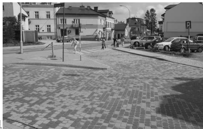
Skrzyżowanie ul. Krzywej z Krakowską