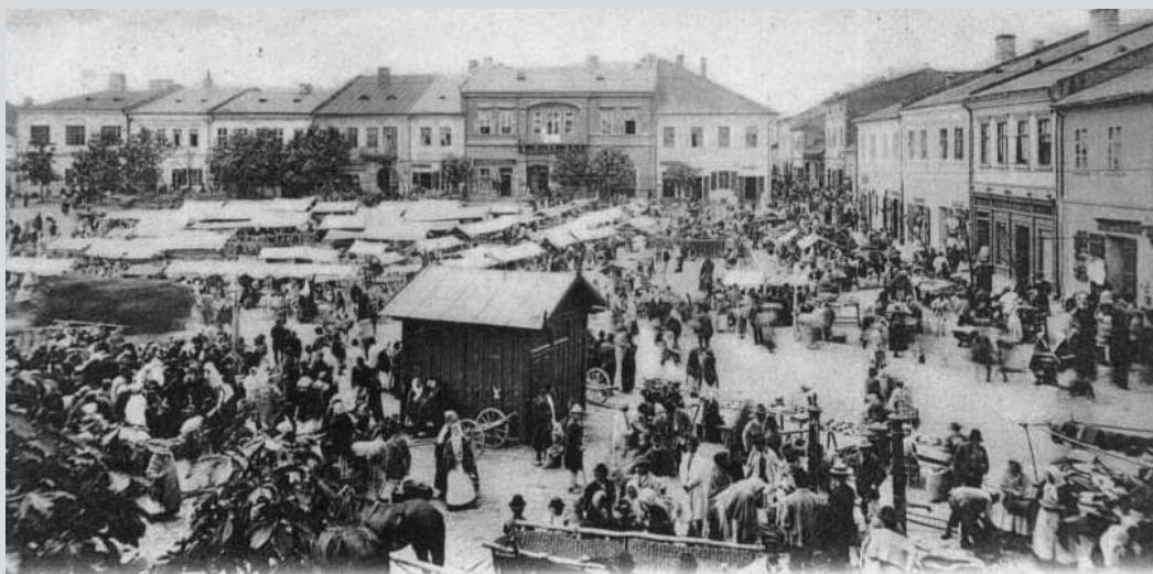
Rynek podczas targu

W dniu otwarcia kupcy handlowali tylko w głównym obiekcie Jarmarku Pogorzańskiego. Przybyłych witała gorlicka Orkiestra Dęta. Pod wiatłą odbywały się występy zespołów. Pierwszym – inauguracyjnym nową gorlicką targowicę – był, co oczywiste, zespół „Pogórzanie”. Zakończył to wydarzenie Kabaret Pod Wyrwigroszem. Na placu występowała grupa teatralna „Shade” z GCK, która spektaklem „Rozwój” – wywołała emocje i wrażenia widzów oraz grupa antyterrorystyczna – wywołująca podziw i grozę wśród najmłodszych. Eksperymentalnie Grupa Teatralna zagrała też swoją wizję i interpretację sceny balkonowej z „Romea i Julii”. O godz. 22.00 nad Jarmarkiem Pogorzańskim i miastem Gorlice pojawiły się pełne barw sztuczne ognie, jakby oznajmiając odejście w mroki dziejów miasta średniowiecznych jarmarków i targów na targowicy w okolicach Dworzyska, jarmarków z kramami na gorlickim Rynku, handlu – od 1810 r. – bydłem i nierogacizną” na Targowicy za mostem na Zawodzie, bazarów przy ul. Słowackiego, gdzieś w okolicach dzisiejszego Ronda, przy ul. Kościuszki, gdzie dziś stacja paliw „Grosar”, jarmarku koło stadionu OSiR i Placu Targowego przy ul. Legionów.