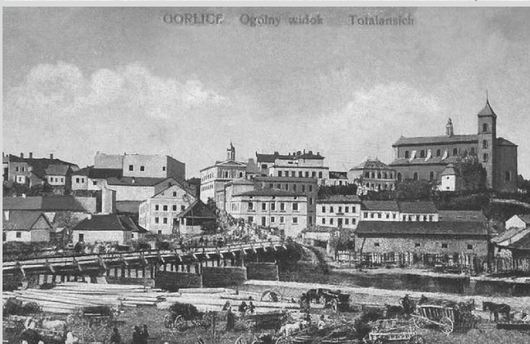
GORLICE. Ogólny widok. Totalansicht

Wcale sympatyczne miasteczko do Gorlice całym się żyje