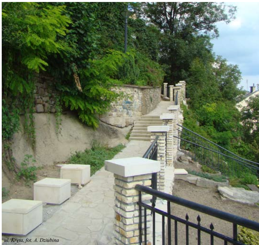
ul. Kręta

W związku z tym wjazd w ulicę Wąską przez kilka tygodni będzie niemożliwy. Natomiast w najbliższych dniach zakończone zostaną prace przy infrastrukturze podziemnej na ulicy Cichej. Wówczas dojazd do skrzyżowania ulic Wąskiej i Cichej będzie możliwy od strony ulicy Piekarskiej. Poruszanie się jednak ulicą Cichą będzie bardzo utrudnione ze względu na brak nawierzchni. Nie będzie tu również możliwości dłuższego parkowania. Kończą się prace na ul. Krętej i ul. Stromej, gdzie trwa montaż poręczy.