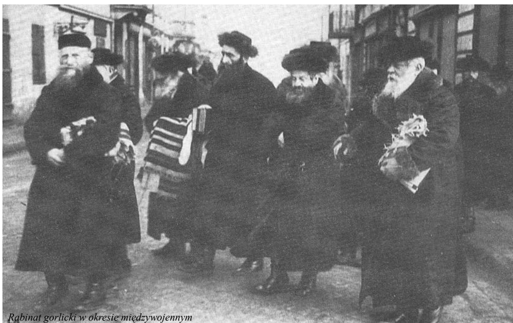
Rabinat gorlicki w okresie międzywojennym