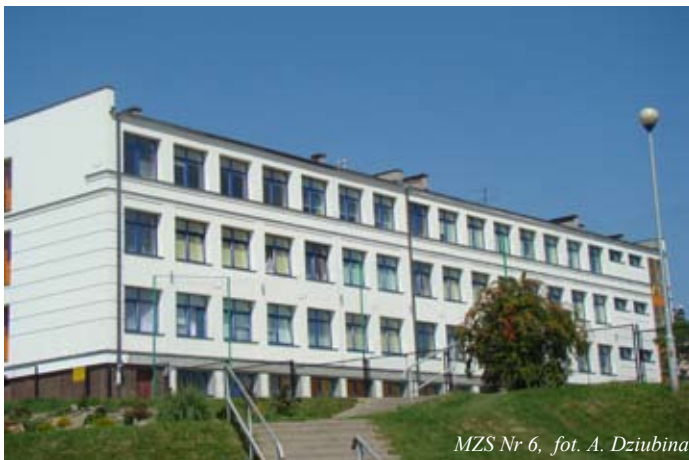
MZS Nr 6

Przez cały okres wakacyjny w sześciu miejskich placówkach oświatowych trwały prace inwestycyjno-remontowe w ramach projektu termomodernizacji obiektów użyteczności publicznej dofinansowywanych ze środków Funduszu Spójności w ramach Programu Operacyjnego Infrastruktura i Środowisko w latach 2007-2013.