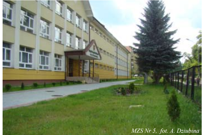
MZS Nr 5, fot. A. Dziubina

W odróżnieniu od malejącej liczby uczniów w szkołach, dostrzec można wyraźny wzrost w miejskich przedszkolach i oddziałach przedszkolnych przy szkołach podstawowych. Łącznie w roku szkolnym uczęszczać będzie 613 dzieci – 513 w pięciu miejskich przedszkolach oraz 100 w oddziałach przedszkolnych w trzech szkołach podstawowych. W porównaniu do roku szkolnego 2010/2011 – 580 dzieci, ilość przedszkolaków wzrosła o 33 milusińskich.