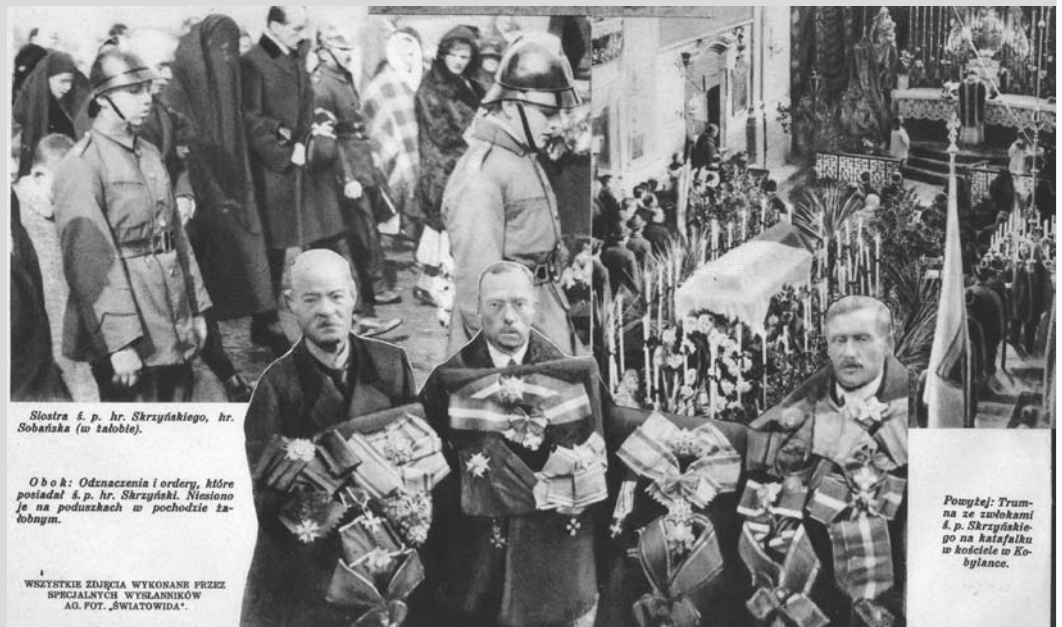
Siostra ś. p. hr. Skrzyńskiego, hr. Sobańska (w tablicy).