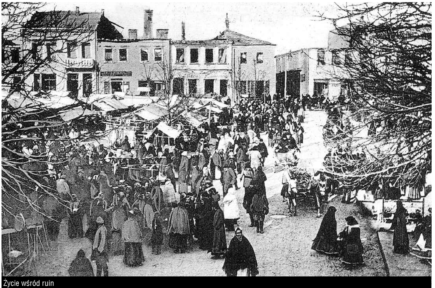
Życie wśród ruin