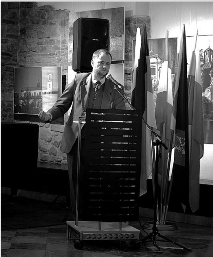
Tekst i foto: M. Lopata