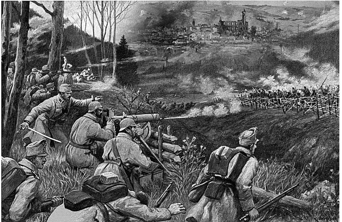
Bitwa pod Gorlicami - hybryda

27 kwietnia br. w Muzeum Regionalnym PTTK im. I. Łukasiewicza w Gorlicach odbył się wernisaż wystawy „Gorlicom Victoria!”. W 100. rocznicę Bitwy Gorlickiej.