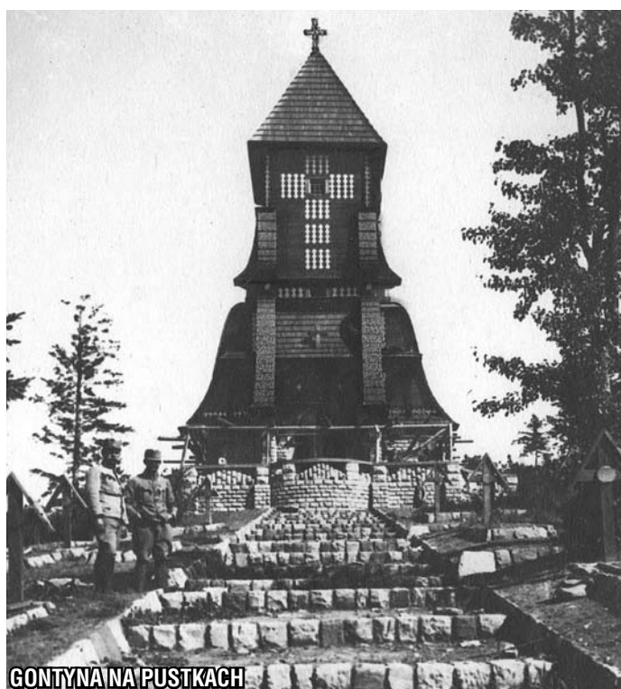
GONTYNA NA PUSTKACH

Na wystawę do Domu Polsko-Słowackiego zapraszamy do 28 maja br.