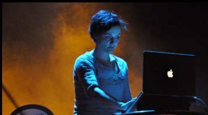
fol. A. Nowak