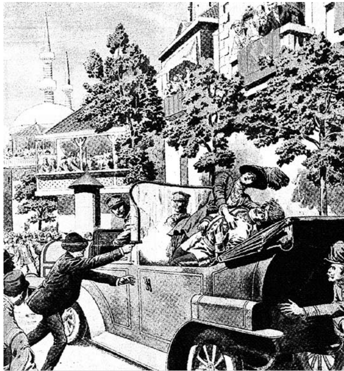
Zamach w Sarajewie na arcyksięcia Franciszka Ferdynanda

"... Uczynię więcej niż to, co obowiązek nakazuje, spełnić może i pragnie naród, jeżeli zrodzi się w nim przekonanie, że niezawisłość państwowa stanie się udziałem i innych ziem polskich".