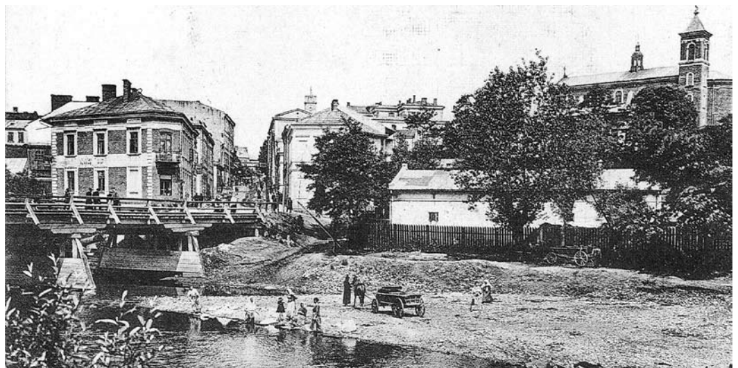
Gorlice 1914 r.

Roman Dziubina „Z dziejów Gorlic” rozdział XXXVIII cdn.