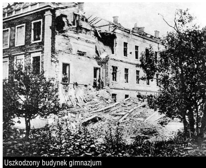
Uszkodzony budynek gimnazjum