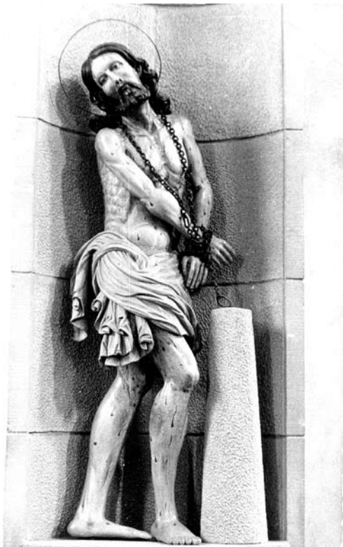
Figura pochodzi prawdopodobnie z XVI lub XVIII wieku. Posiadane dokumenty pozwalają twierdzić, że była już czczona przed rokiem 1700. Mieszczanin gorlicki Cieślík wybudował dla figury Pana Jezusa u Słupa kaplicę, zwaną Carceris Christi - Więzienie Chrystusa. Stała do czasu I wojny światowej w południowej części cmentarza przykościelnego, o czym przypomina

Od wieków cieszy się szczególnym nabożeństwem. Jest niezwykle sugestywna. Ukazuje dramatyzm, cierpienie i smutek uwięzionego Chrystusa. Postać Chrystusa cierpiącego otoczona jest powszechną czcią nie tylko parafian gorlickich - również wiernych z bliższych i dalszych okolic, przed wiekami nawet z Węgier i Słowacji.