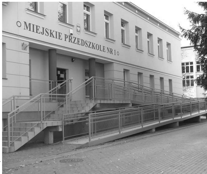
Miejska Przedszkole Nr 1