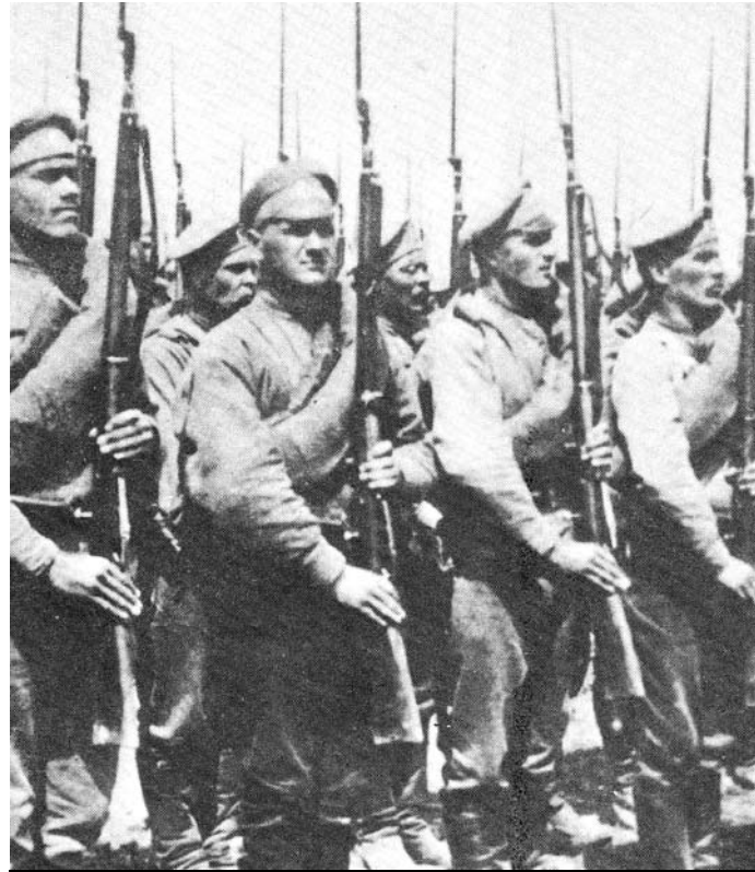
Rosyjscy żołnierze 1914 r.

blisko 1,5 tysiąca żołnierzy i kilkuset zgromadzonych gorliczan, czterem żołdakom wymierzono po 25 łóz.