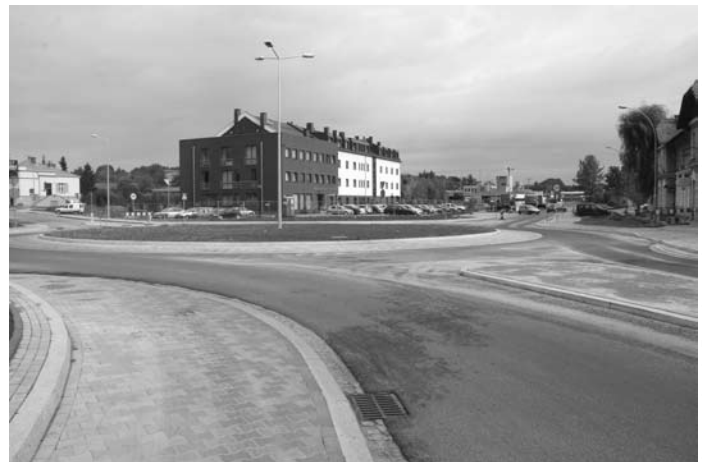
Łącznik ul. Bardiowskiej z 11 Listopada

Ponadto: przebudowa ulicy Korczaka oraz budowa łącznika ul. Bardiowskiej z ul. 11 Listopada (wartość inwestycji - 5 mln zł, w połowie finansowana ze środków rządowych), termomodernizacja