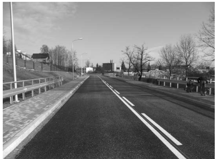
Ul. Marii Rydarowskiej