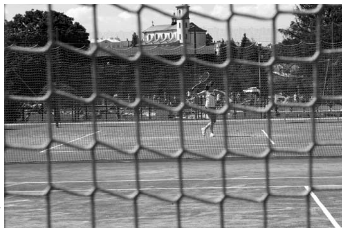
Korty tenisowe - lodowisko