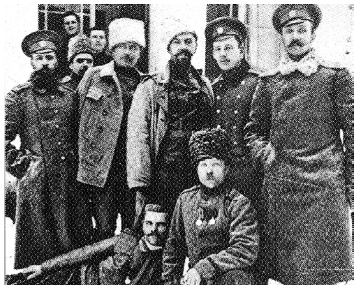
Sztab rosyjski w Gorlicach 1914-1915