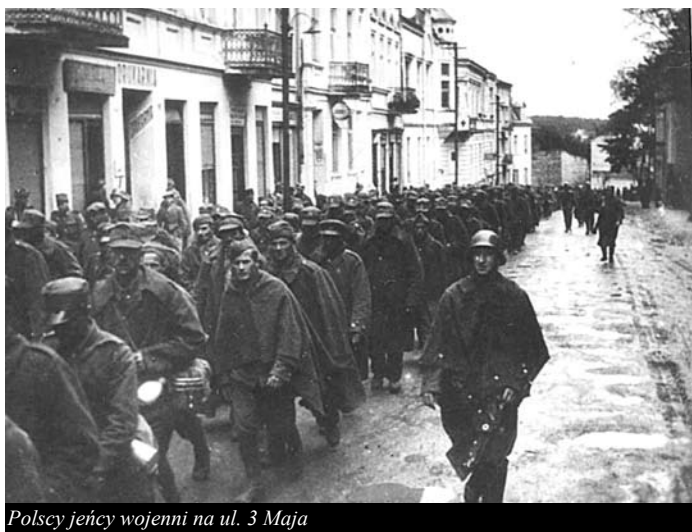
Polscy jeńcy wojenni na ul. 3 Maja