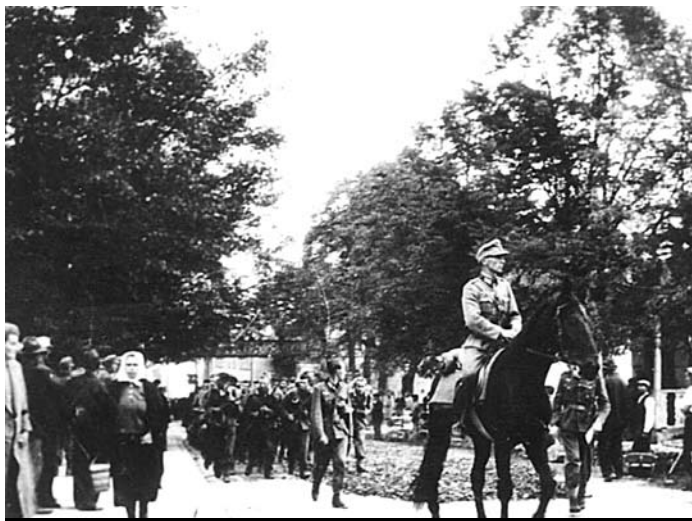
7 września 1939 r. - pierwsze oddziały niemieckie wkraczają ul. Mickiewicza do Gorlic

1 września br. minęło 74 lata od tragicznego dla Polski od Polaków wydarzeń – agresji III Rzeszy niemieckiej na Polskę. Stała się ona początkiem II wojny światowej – ogromu cierpień i ofiar, również dla mieszkańców Ziemi Gorlickiej.