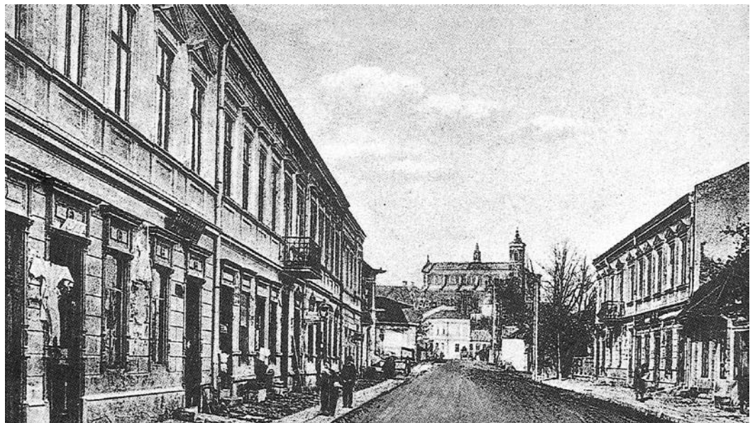
Gorlice w 1915 r. (ul. Mickiewicza od strony Zawodzia)

Roman Dziubina „Z dziejów Gorlic” rozdział XXXVIII cdn.