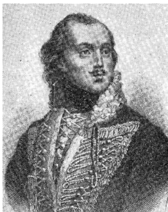
Gen. Kazimierz Pułaski